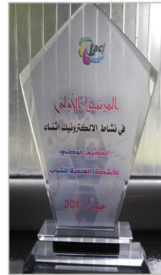
الفوز بالمرتبة الأولى في نشاط الإلكترونيك

قدم النادي العلمي الإلكتروني وعلى حداثة عهده، نشاطات علمية متنوعة كما مثل الجامعة في فعاليات علمية مفتكا التقدير والإعتراف من الجهات المختصة المشرفة. ومن أهم النشاطات التي بادر وشارك بها النادي : • تمثيل جامعة جيجل في الملتقى الجهوي للأندية العلمية المقام في جامعة باجي مختار بعنابة في 11 فيفري 2017. • تنظيم معرض تكنولوجي بجامعة جيجل في 10 أبريل 2017 ( يوم الأردنويو). • خرجة تعليمية لثانوية شرايطية يوسف بالعوانة