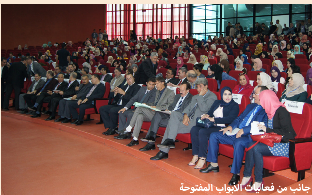
جانب من فعاليات الأبواب المفتوحة