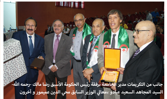
جانب من التكريات مدير الجامعة برفقة رئيس الحكومة الأسبق رضا مالك -رحمه الله- السيد المجاهد السعيد عبادو ، معالي الوزير السابق محي الدين عميمور و آخرون

بهجة هذه الفعاليات التي تمت في جو منظم بهيج اكتملت بتكريم عائلة الفقيه وضيوف الجامعة وكذا الأساتذة الحاصلين على رتب علمية جديدة والطلبة الحاصلين على منح الإقامة في الخارج وبعض أبناء الأسرة الثورية لولاية جيجل.