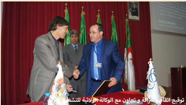
توقيع اتفاقية شراكة وتعاون مع الوكالة الولائية للتشغيل