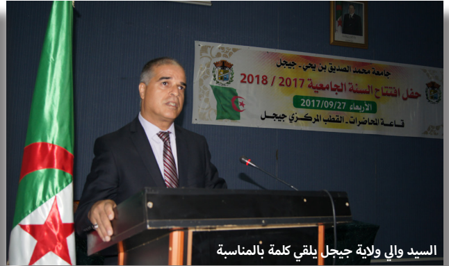
السيد والي ولاية جيجل يلقي كلمة بالمناسبة