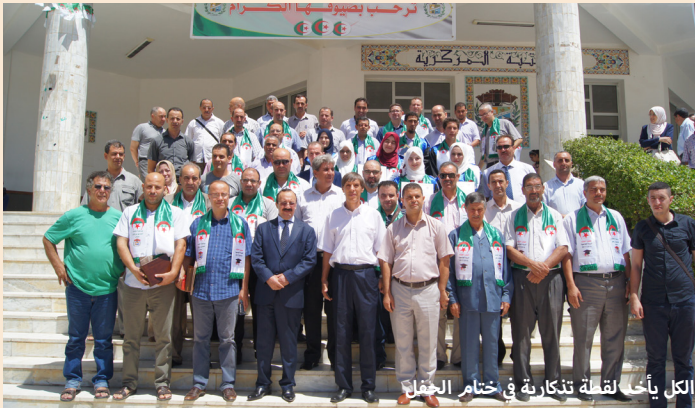
الكل يأخذ لقطة تذكارية في ختام الحفل