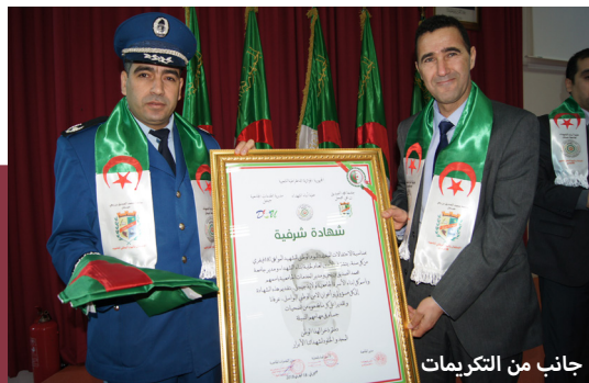
جانب من التكريمات