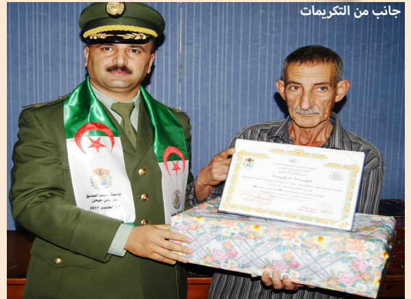
جانب من التكريات