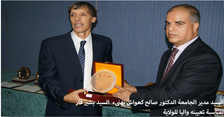
السيد مدير الجامعة الدكتور صالح كعواش يهنيء السيد بشير فار بمناسبة تعيينه واليا للولاية

احتضن القطب الجامعي المركزي بجيجل يوم 27 سبتمبر 2017 فعاليات حفل افتتاح الموسم الجامعي 2017 - 2018 بحضور نوعي من نخبة وإطارات الولاية على رأسهم السيد والي الولاية في أول زيارة تشريفية له لجامعة جيجل.