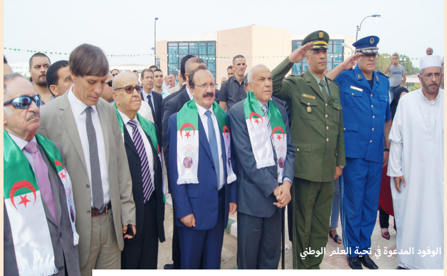
الوفود المدعوة في تحية العلم الوطني

هذه الإحتفالات التي بادرت بها جامعة جيجل يوم 18 ماي 2017 بالتنسيق مع مديرية المجاهدين ودار الثقافة عمر أوصديق و برعاية من السيد والي ولاية جيجل ، كانت سمتها الأبرز حضور قانات سياسية وعلمية كبيرة من الباحثين ورفقاء الشهيد ، حيث كان القطب الجامعي بتاسوست شاهدا على احتفالية كبيرة احتوت على فعاليات عديدة تفاعل معها الجمهور الحاضر الذين غص بهم بهو وقاعة المحاضرات.