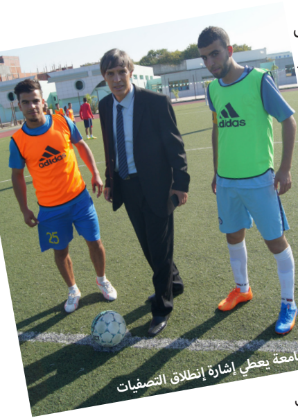
مدير الجامعة يعطي إشارة إنطلاق التصفيات

وقد تأهلت جامعة جيجل ممثلة لولاية جيجل إلى الأدوار الجهوية بعد لقاءات فاصلة مع فرق مديرية الخدمات بعد فوز فرقها في كل اللقاءات والرياضات التي شاركت بها. هذا، وقد انطلقت منافسات الأدوار الجهوية منذ بداية شهر جانفي في مختلف الرياضات بمختلف الولايات الشرقية للوطن وتحقق فيه فرق جامعة جيجل نتائج جد مشرفة و ذلك بتأهل منتخب كرة السلة وكرة القدم ذكور لكأس الجمهورية الجامعي.