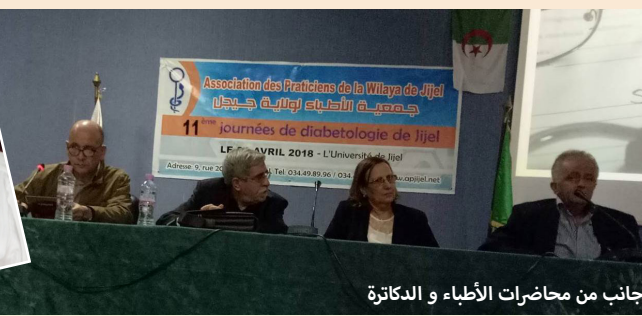
جانب من محاضرات الأطباء و الدكاترة

كانت قاعة المحاضرات بالمكتبة المركزية يوم 21 أبريل 2018 فضاء لأشغال الطبعة الحادية عشر من فعاليات اليوم الدراسي حول مرض السكري التي تبادر به كل سنة جمعية أطباء ولاية جيجل، وهو اليوم الذي شارك فيه عدد كبير من الأطباء المختصين بالولاية إضافة إلى أطباء من مدينتي قسنطينة وسطيف والذي تضمن إضافة على معرض متنوع احتوى عديد