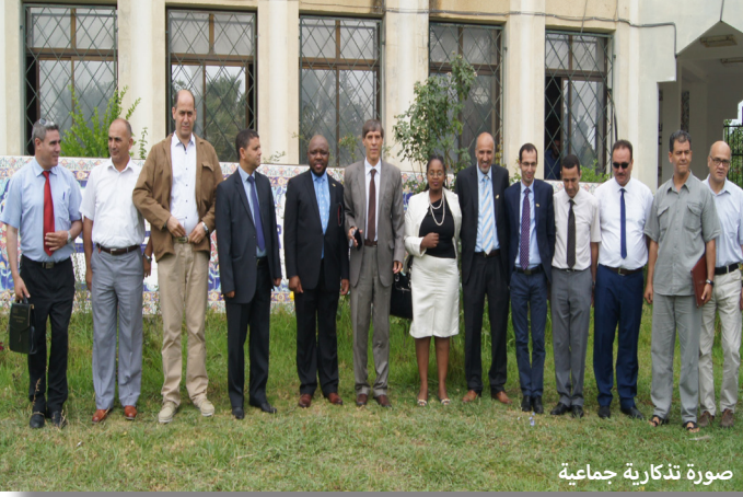
صورة تذكارية جماعية