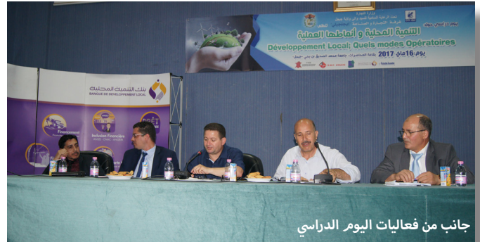
جانب من فعاليات اليوم الدراسي