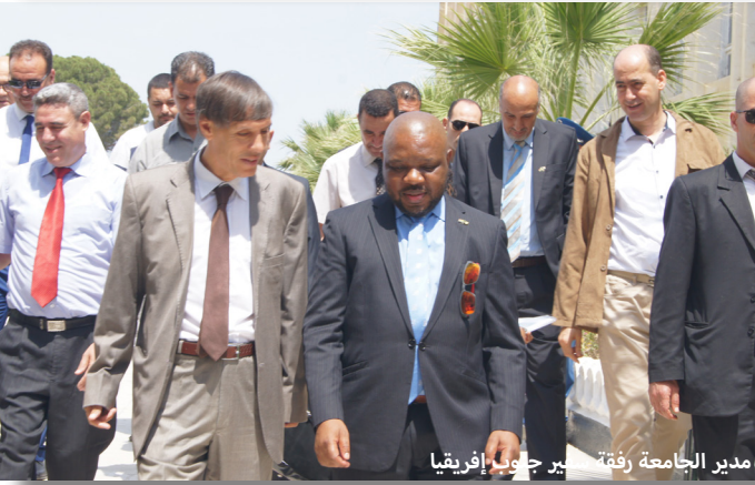
مدير الجامعة رفقة سفير جنوب إفريقيا

كانت جامعة محمد الصديق بن يحي محطة لزيارة شرفية قامت بها سفيرة الولايات المتحدة الأمريكية بالجزائر السيدة جوانا بولاشيك Joana polachik التي حلت ضيفة على الجامعة مع وفد مرافق يوم 30 ماي 2016 حيث استقبلت من طرف الأستاذ صالح كعواش بالقطب الجامعي جيجل الذي تزامن تاريخ تعيينه على رأس إدارة الجامعة مع الزيارة ذاتها.