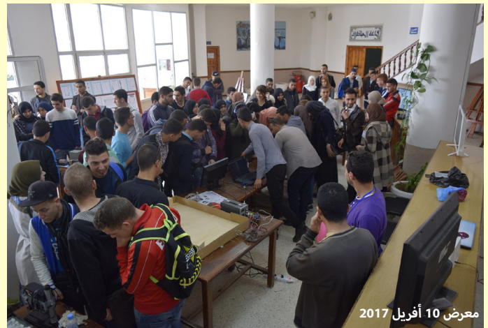
معرض 10 أبريل 2017