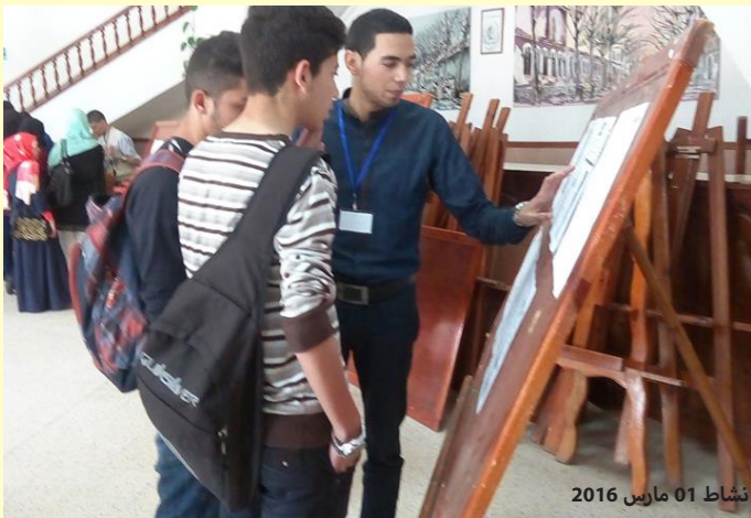
نشاط 01 مارس 2016